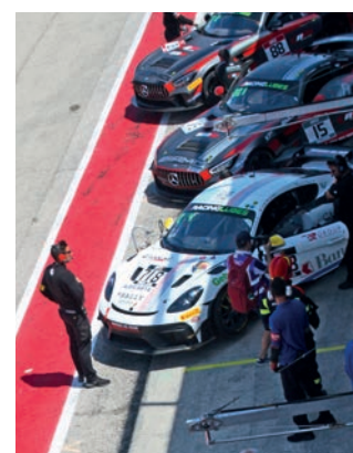
Grandi soddisfazioni e tanta determinazione per il Team dei Centri Porsche Ticino.