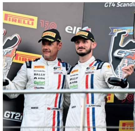
GT4 European Series pagina 16