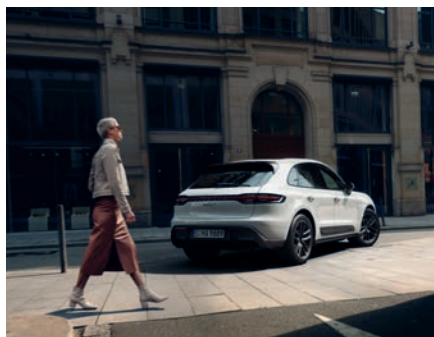
Macan T – ancora più dinamica pagina 9