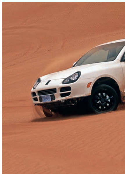
20 anni di emozioni off-road con la Porsche Cayenne pagina 12