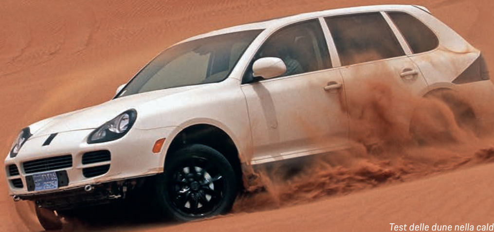
Test delle dune nella calda Dubai: test di resistenza per il progetto "Colorado" nei primi anni 2000