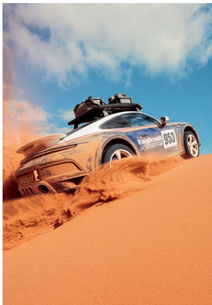
Mehr Abenteuer geht nicht: 911 Dakar Seite 12