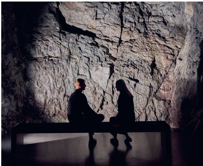
Museum Susch, Zernez