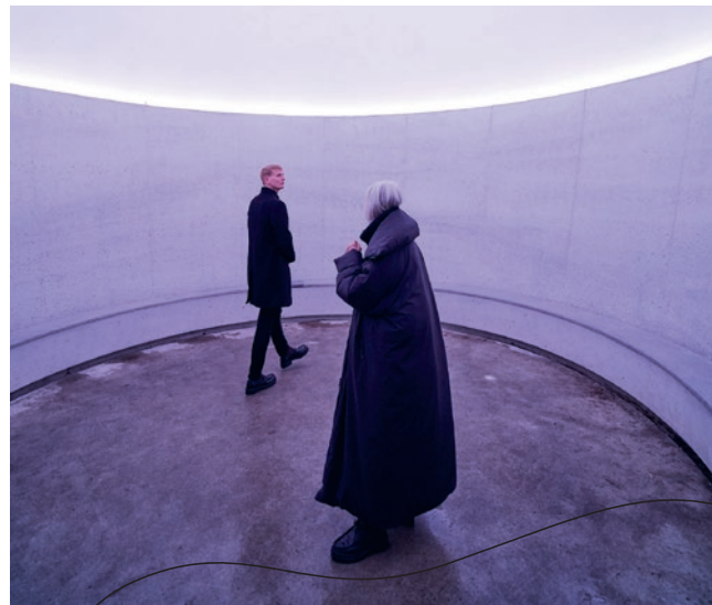
Skyspace Piz Uter, 2005, James Turrell, Zuoz