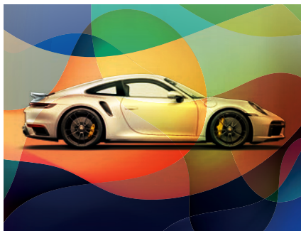
75 Jahre Porsche Seite 08