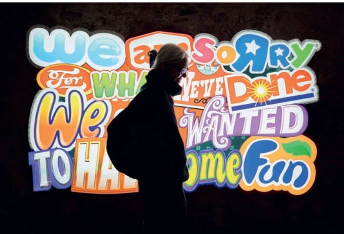
We Are Sorry, 2013, Jani Leinonen, Stalla Madulain