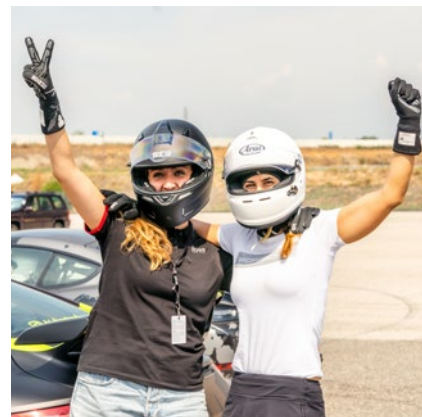
PorShe Porsche Ladies Day Seite 17

04 DREAMERS ART TOUR Die Kunst des Roadtrips