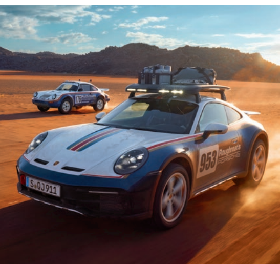
911 Dakar mit Rallye-Design-Paket und 911 Carrera 2.2 4x4 Paris-Dakar (953)

Ferry Porsche hat es selbst am treffendsten ausgedrückt: «Der 911 ist das einzige Auto, mit dem man von einer afrikanischen Safari nach Le Mans, dann ins Theater und anschliessend auf die Strassen von New York fahren kann.» Und kein 911er dürfte besser dafür geeignet sein als der neue 911 Dakar. Denn dieser verfügt über ein höhergelegtes Sportfahrwerk inklusive aktiver Wankstabilisierung sowie zahlreiche Leichtbauelemente, geländegängige Reifen, Tequipment-Zubehör und ein Rallye-Design-Paket, das an die Optik des Originals erinnert.